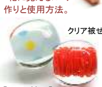
泡入り水玉 & 泡入り花玉